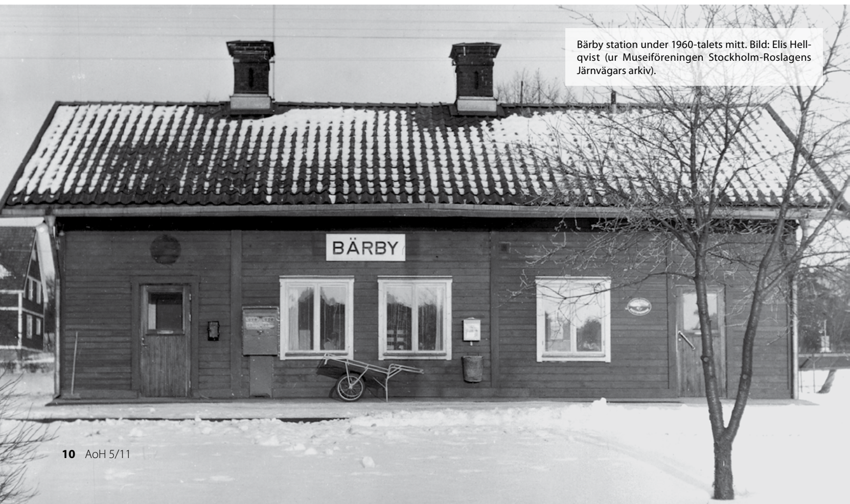
Bärby station under 1960-talets mitt.

Ursprungligen var Bärby stationshus med ekonomibygnader målade i gult med vita knutar. Senare fick allt vitt en mörkare ton; vissa foton antyder detta från slutet av 1800-talet. 1910 målades stationen om med Falu rödfärg och vita fönsterfoder och vindskivor. Samtidigt